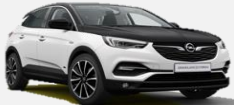
Svart Motorhuv CNP 2 500kr Tillval Ultimate