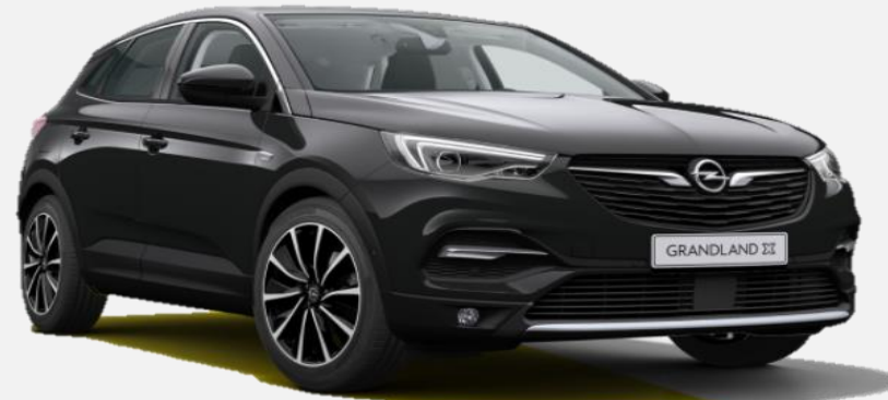
Diamond Black G70 6 900kr