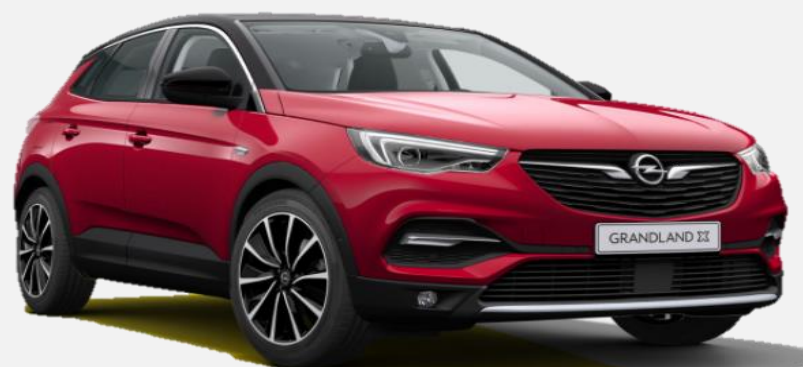
Dark Ruby Red GDU 7 900kr