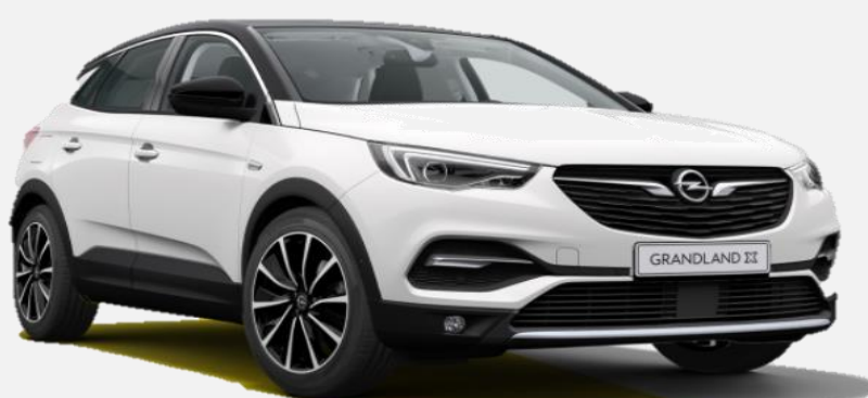
White Jade G20 0 kr