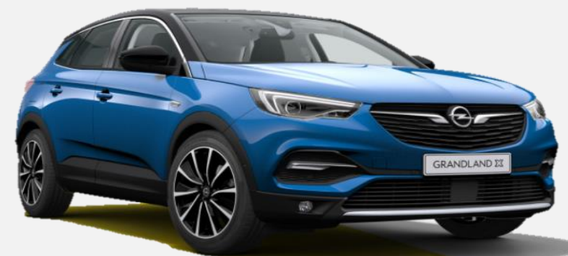
Topaz Blue G8Z 7 900kr