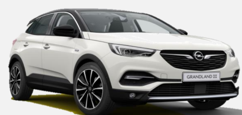
Pearl White G1o 7 900kr