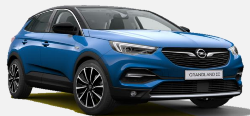
Topaz Blue G8Z 7 900kr