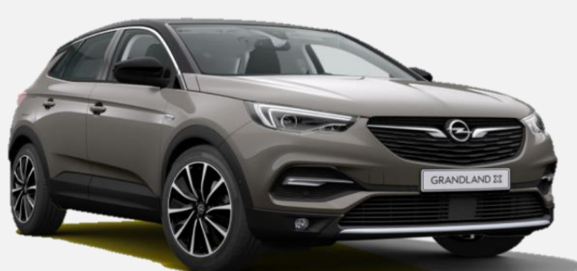
Moonstone Grey G4o 6 900kr