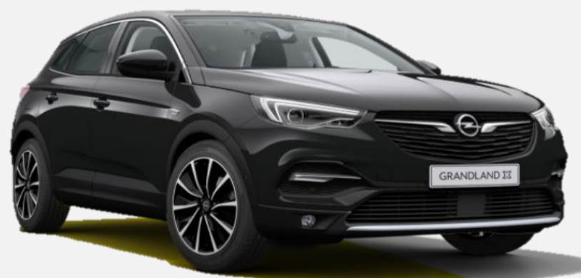
Diamond Black G7o 6 900kr