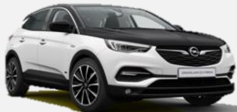
Svart Motorhuv CNP 2 500kr Tillval Ultimate