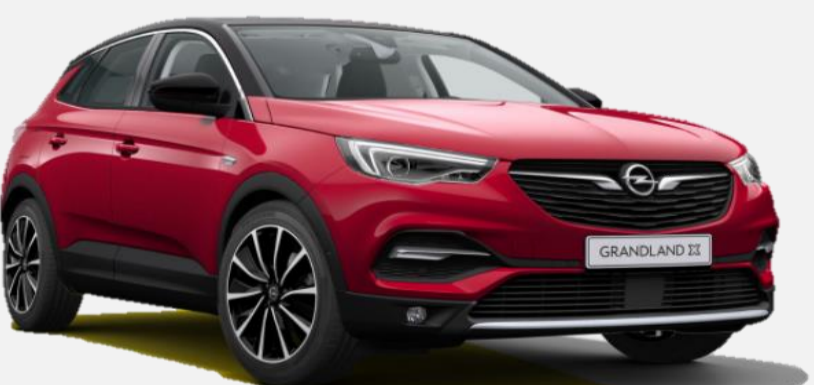
Dark Ruby Red GDU 7 900kr