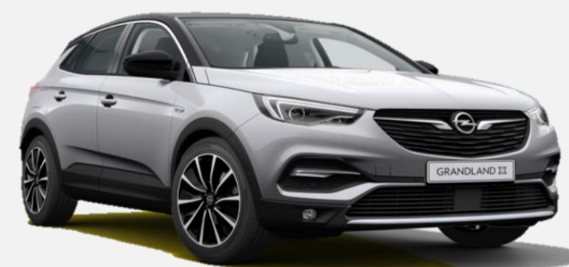
Quartz Grey G4i 6 900kr